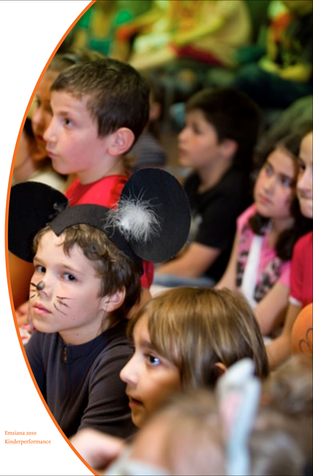
Emsiana 2010 Kinderperformance