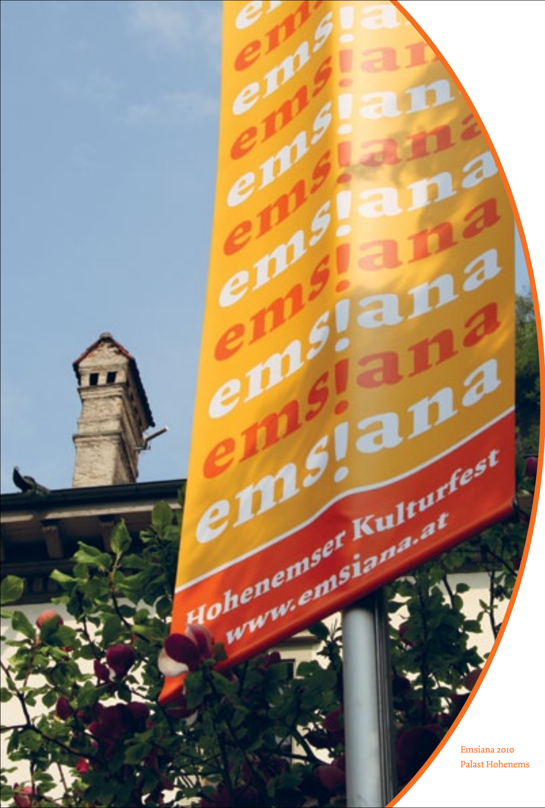
Emsiana 2010 Palast Hohenems