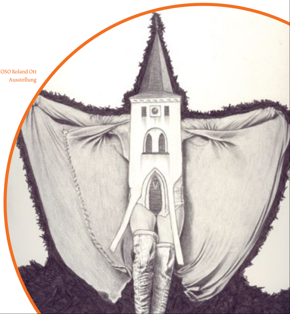
FURIOSO Roland Ott Ausstellung